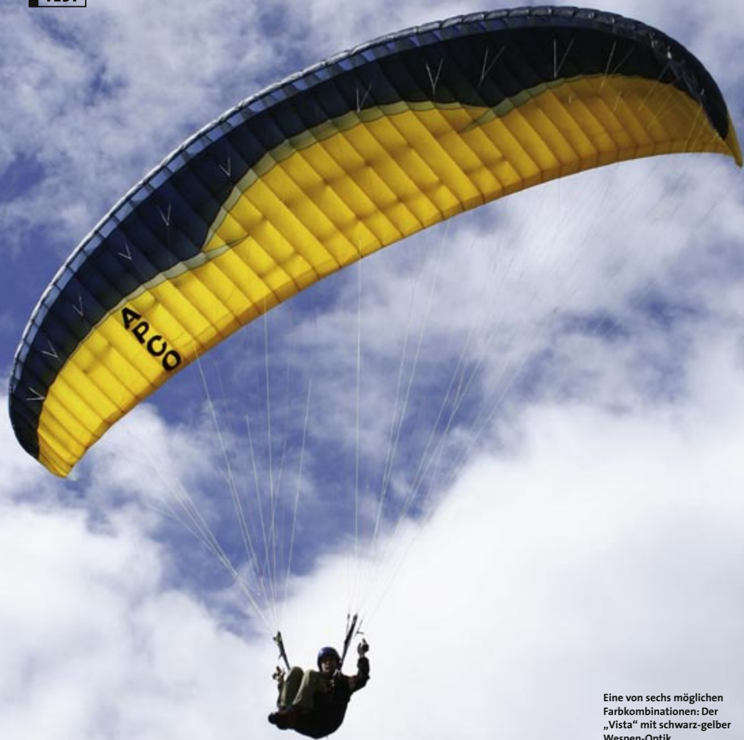
Eine von sechs möglichen Farbkombinationen: Der „Vista“ mit schwarz-gelber Wespen-Optik.